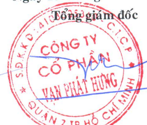
TRƯƠNG THÀNH NHÂN